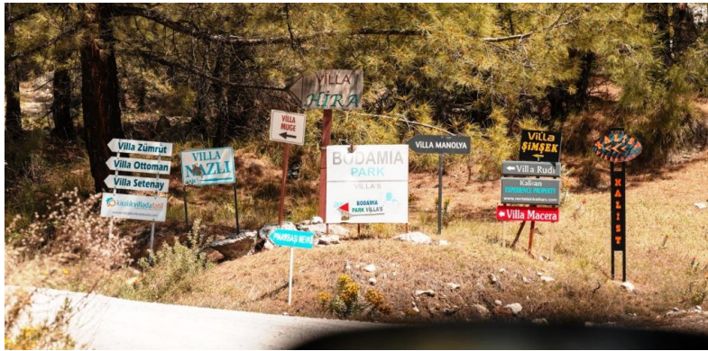
İslamlarda Çevresel Karışıklık