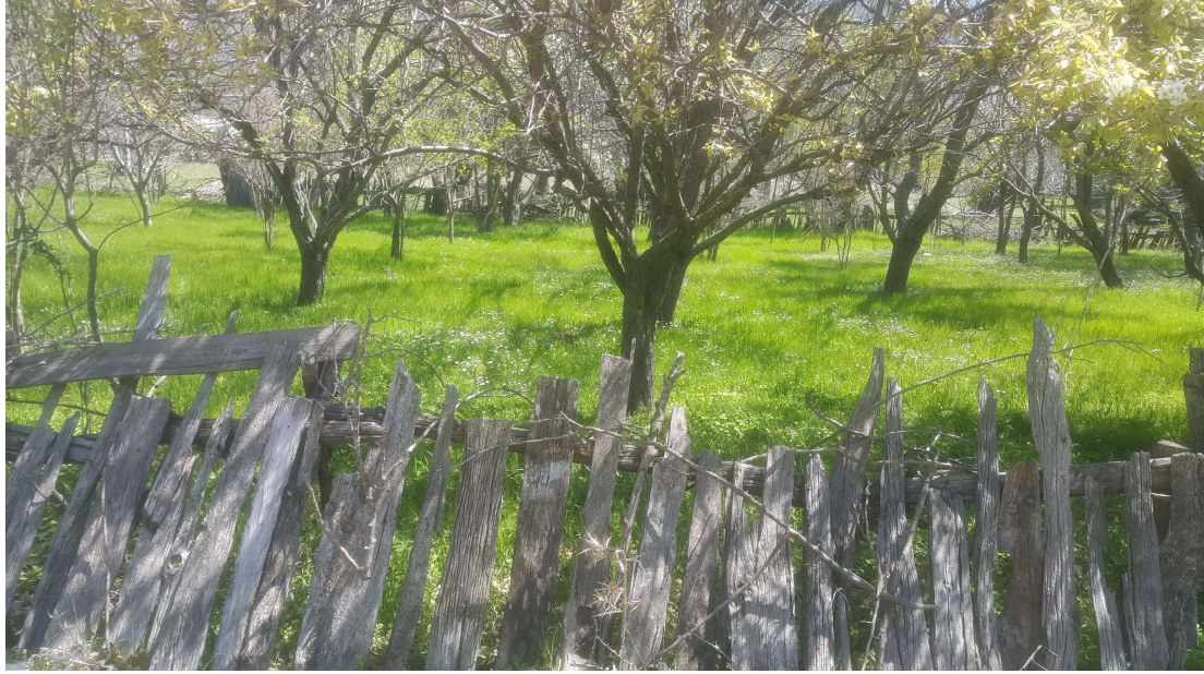
Çiçek Zamanı Bezirgan